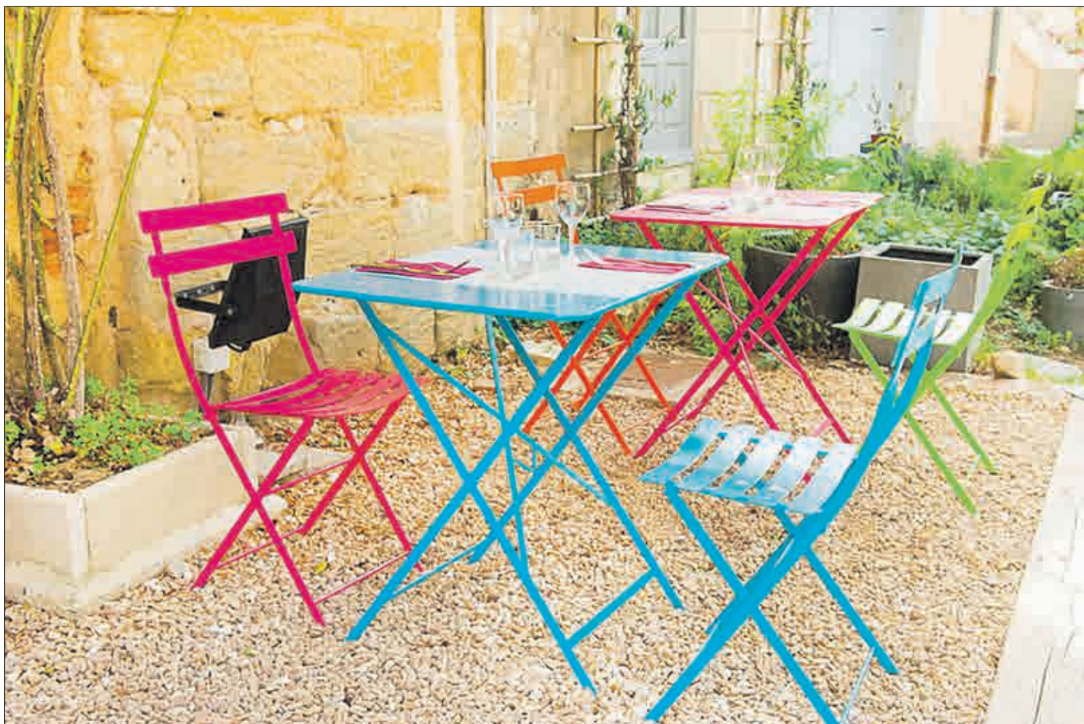
Malebná umí dát svěžest i kovovým židlím. Ty přímo lákají k posezení a konzumaci grilovaných pochoutek.