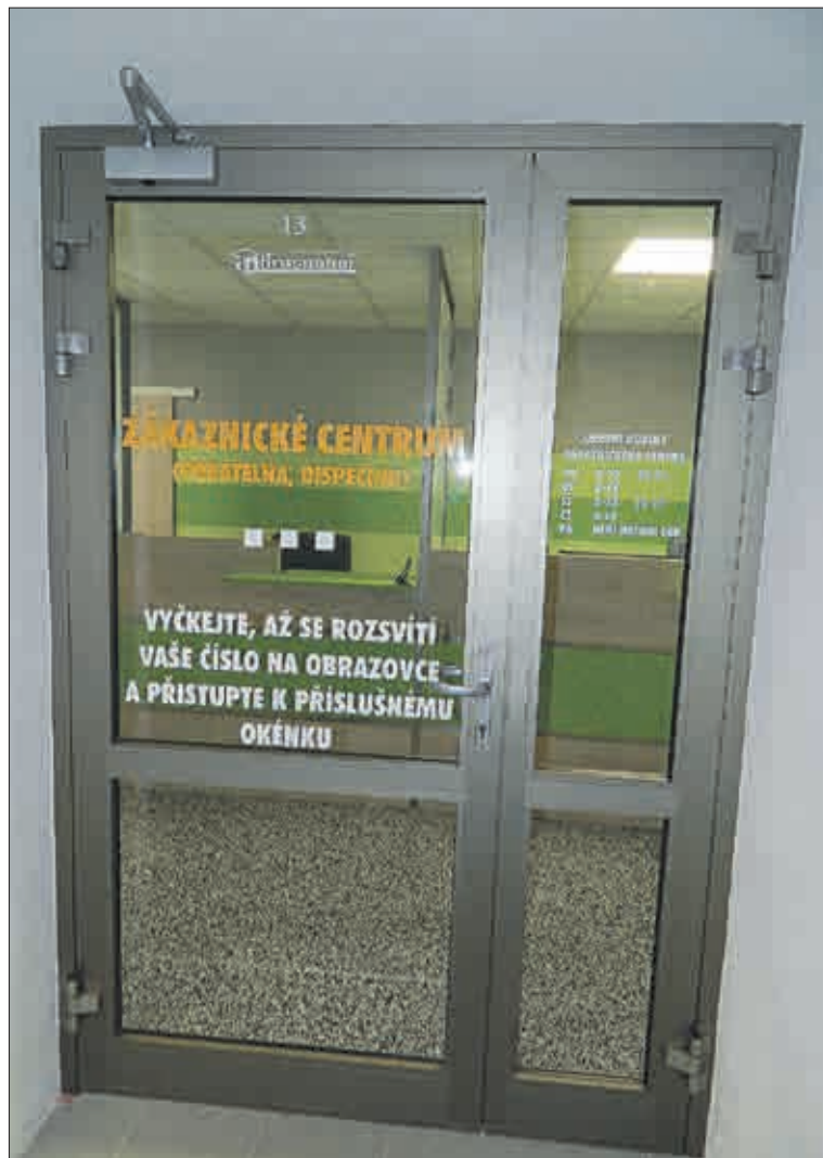
V prosinci to budou přesně dva roky, co v budově správy družstva vzniklo zákaznické centrum. Vchod do něj je z haly recepcce. Vzniklo v zájmu zkvalitnění kontaktu s klienty a přispělo k urychlení vyřizování jejich záležitostí.

Dokážu se vžít do této situace, kdy máte řešit mou stížnost