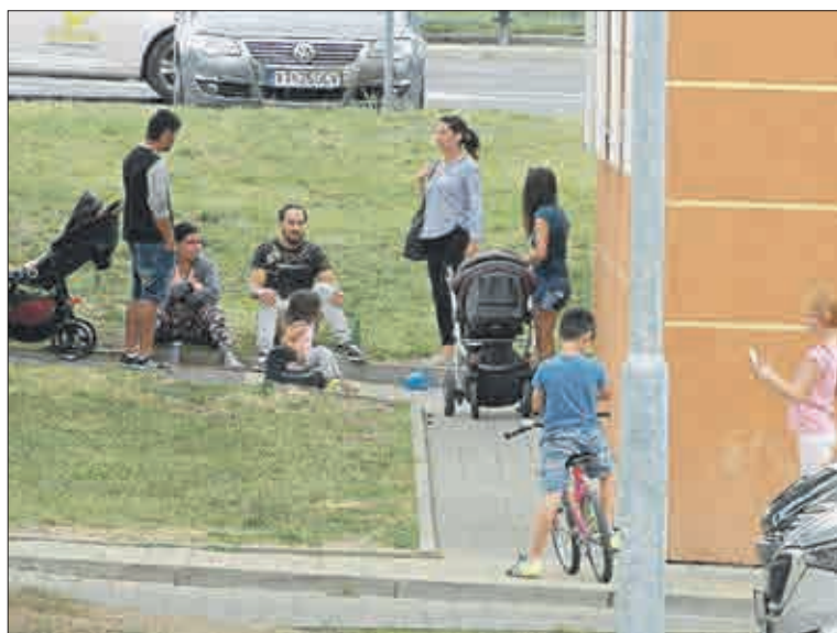
Kolektivní způsob života je na denním pořádku.