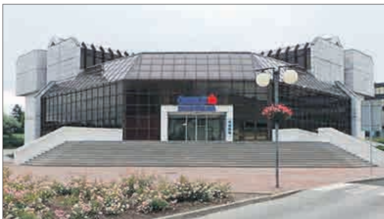
V mostecké pobočce České spořitelny je jednací salonek věnovaný jezeru Most.