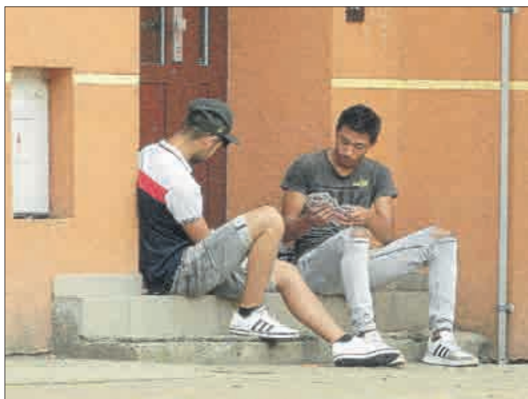
Mládenci si raději dávají partičku karbanu.