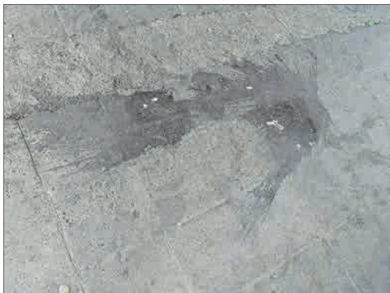
Tady někdo rozbil dvě láhve s nápoji.