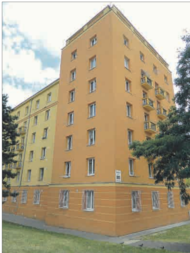
Blok 100 – dominanta lokality pohledem od Chomutovské ulice. Problémy v soužití zde opět narůstají.

Rozhodla jsem se koupit byt v této lokalitě ještě v době, kdy v ní nebyla situace tak katastrofální. A tento dům jsem si vyhlédla proto, že bylo na první pohled vidět, že v něm žijí docela slušní lidé. Ale to okolí dnes! Je katastrofální! Podívejme se na situaci konkrétněji. V sousedním bloku 100 chybí předseda. Je tam úřední správce stanovený Krušnohořem. Lidé tam bydlící totiž nebyli schopni se domluvit na sestavení a zvolení domovního výboru. Úřední správce ale není funkcionář. Je to úředník, který v domě nebydlí, jen do něj dochází – ve svých úředních hodinách stanovených pro bydlící. Úřední správce ale není domovní výbor SVJ, nemá tak široké kompetence jako výbor, těžko tedy může ovlivňovat vývoj v domě. Z pohledu běžného bydlícího jako kdyby se tam nic nedělo a situace se tedy může zhoršovat. Navíc fungující domovní výbor předkládá na shromáždění vlastníků jednotek písemné výstupy – informace o činnosti, hospodaření atd., což v případě úředního správce není možné, protože není orgánem SVJ. V podstatě