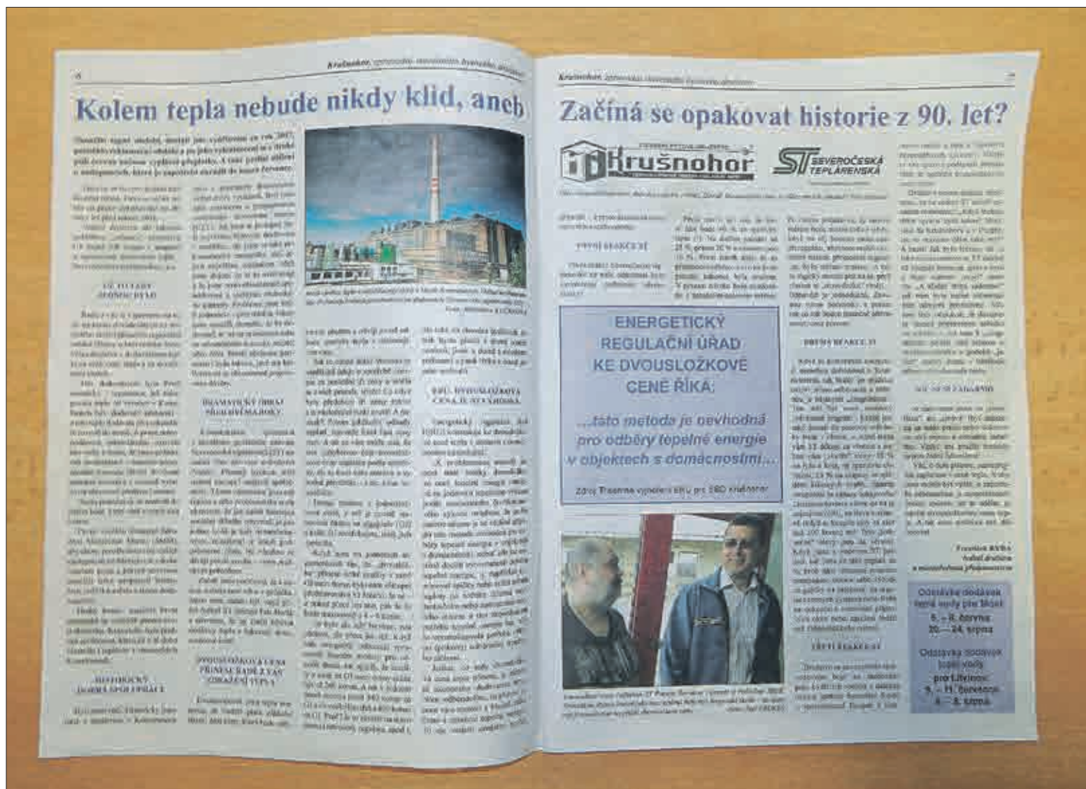
Obsáhlý článek v Krušnohoru č. 6/2018 upozorňuje čtenáře na zhoršující se vztahy mezi Severočeskou teplárenskou a Krušnohorem. Dovojuje, že situace začíná připomínat boj s překupníkem tepla z 90. let minulého století. Připomíná zároveň, že vztahy mezi teplárenskou společností a bytovým družstvem byly původně vynikající. Je šance, že se v dohledné době zlepší?

První návrh dvousložkové ceny Krušnohoru doslova vyrazil dech. Fixní složka, jež bude neměnná, ať bude spotřeba tepla