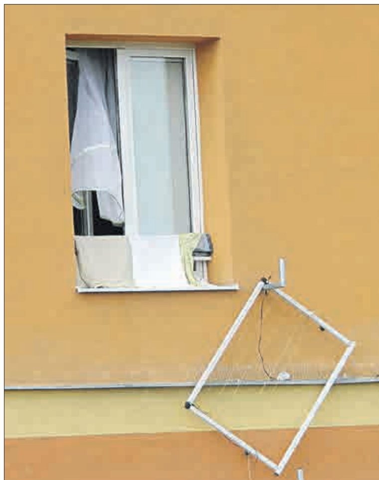
Náhoda? Či nehoda? Nebo projev chuti po ničení?

Městu přitom tato špatná situace nevadí. V sobotu 12. září se bude otvírat jezero Most. Bude to přitažlivá relaxační oblast i pro lidi z celé republiky. Ti sem budou jistě jezdit. To se budou turisté k jezeru Most prodírat přes ty hloučky ve spodní části třídy Budovatelů a koukat na ten bordel