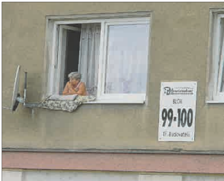
Důkaz o tom, že v domě bydlí i slušní a klidní lidé.

Samozřejmě že bude. Chci ale konečně bydlet jako slušný člověk v kulturním prostředí, v němž mi nehrozí nebezpečí; v prostředí, kde se mohu v klidu vyspat do práce, kde si mohu pustit televizor a sledovat program, aniž by byl rušen hlukem zvenku. Chci si najít byt v cihlové zástavbě o velikosti 3+1.