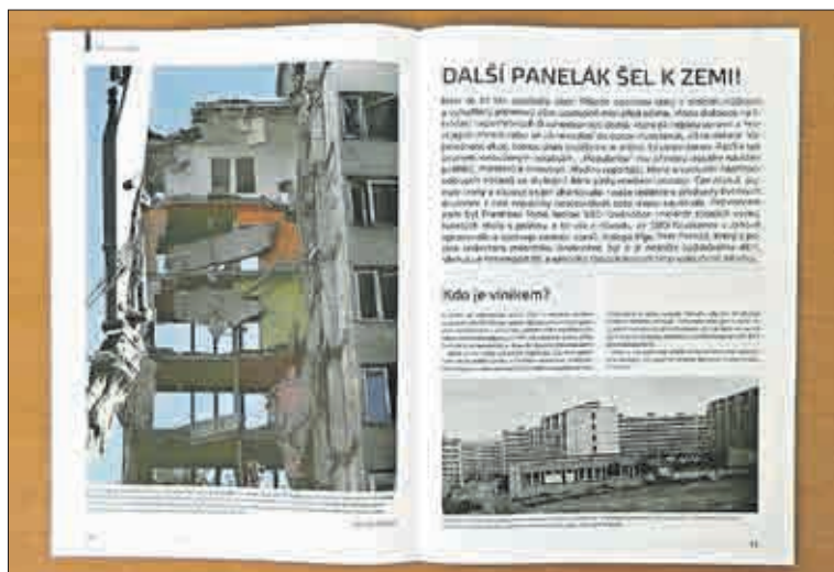
Pět tiskových stran věnoval časopis Bytová družstva – SVJ – správa domů bourání prvního paneláku v Janově.

To se na pěti tiskových stranách věnuje historické události města Litvínova – bourání prvního panelového domu na sídlišti Janov. „Není to až tak ojedinělá akce. Přijede speciální stroj s drticími nůžkami a vybydlený panelový dům postupně mizí před očima (autor článku vychází z předchozích zkušeností, například také ze sídliště Chanov v Mostě – poznámka redakce Krušnohory). Vláda na likvidaci nepotřebných či zanedbaných domů, které již nejdou opravit a hrozí jejich zřícení nebo se už nevyplácí do oprav investovat, dokonce dává dotace.