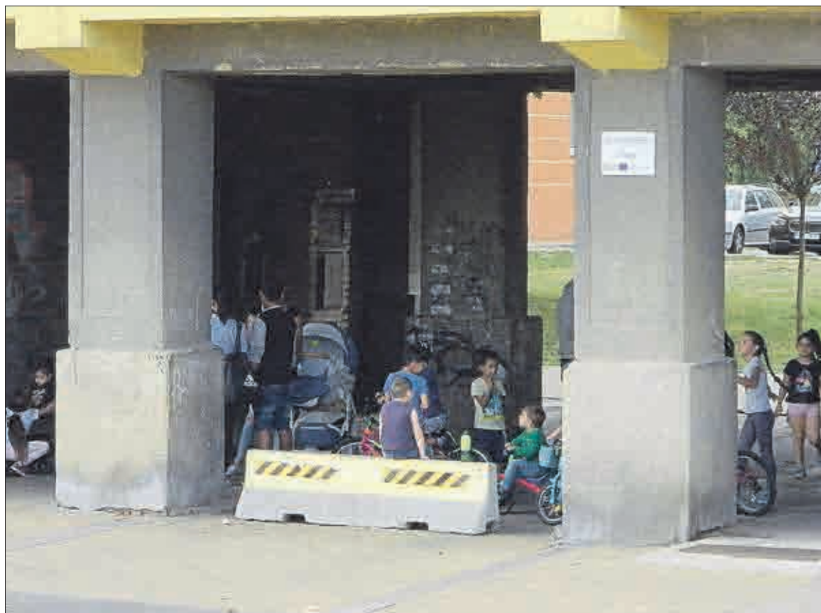
Průjezd je plný od rána do večera dětmi i dospělými a hlukem.

V jednání realitek. Těm je úplně jedno koho do bytů stěhují. Řeknou si no jo, to jsou Stovky –