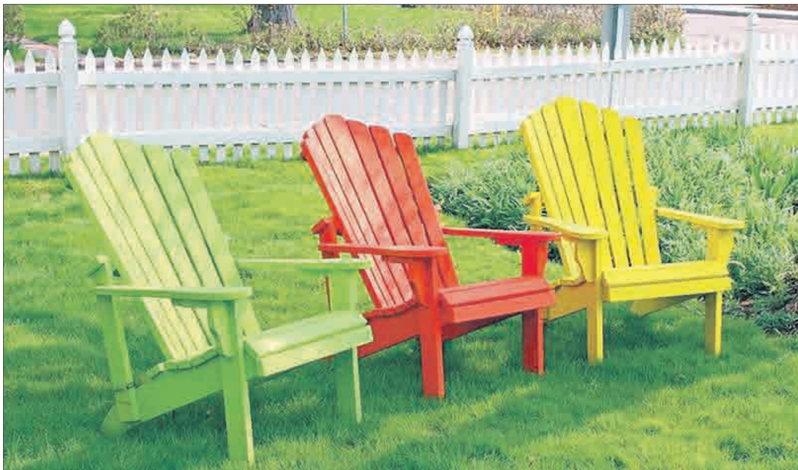
Malebná promění stará dřevěná křesla v přitažlivé kusy nábytku, které dokážou zkrášlit celou zahradu.