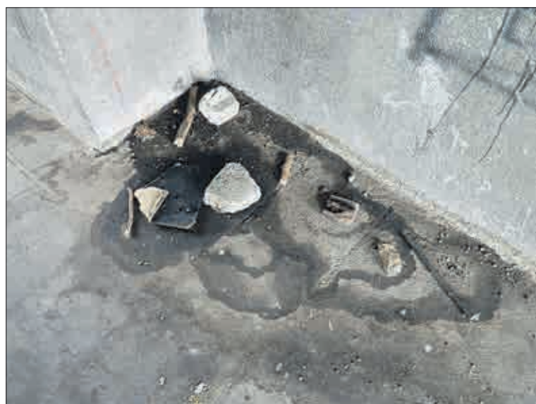
Pach naznačuje, že se zde močí a kálí.