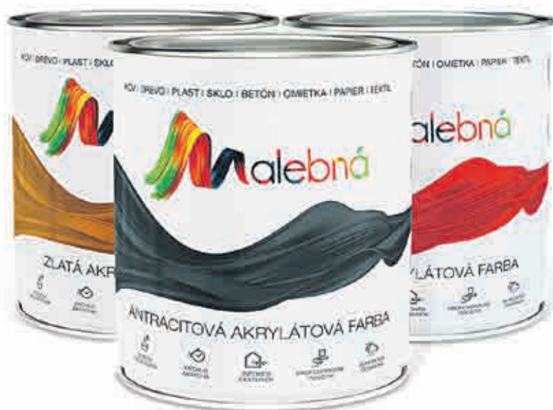
Malebná – univerzální akrylátová barva.