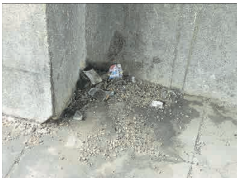
V průjezdu narazíte na odpadky a nečistotu.