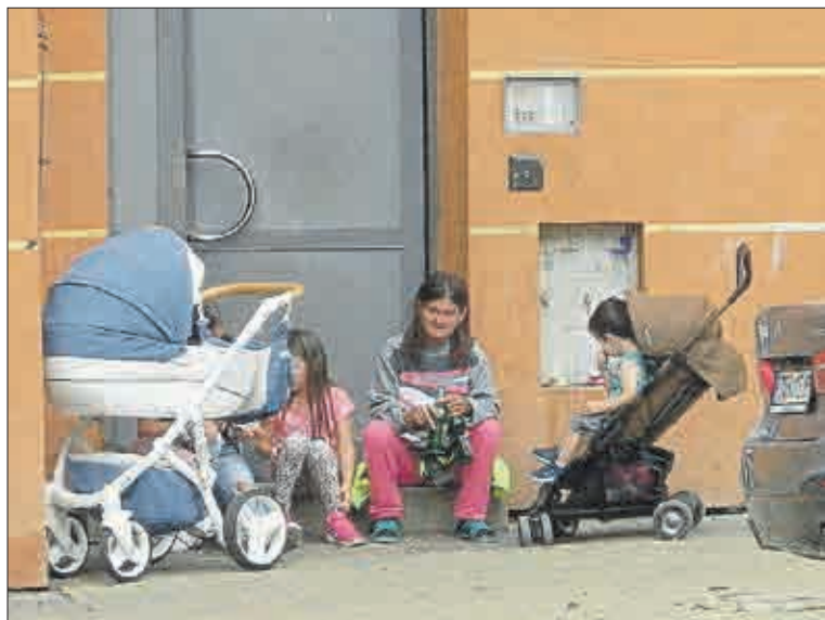
Venkovních radovánek si užívají také malé děti.

Asistenti prevence kriminality sem nechodí. Je pravdou, že ještě před časem je tady bylo vidět. Ale zašivali se tady v průchodu. Pokuřovali a bavili se s místními. Zřejmě s nimi navazovali přátelské vztahy. Taková činnost asistentů prevence kriminality je přece o ničem. Taková asistenti jsou slušným bydlícím k ničemu. Chtělo by to, aby konečně začala fungovat městská policie tak jak má. A víc aby dělala pochůzky. Jejich nedostatečný výkon znamená, že se to ve Stovkách začíná zvrhávat. Je to tady nebezpečné. Je to tady dokonce úplně šílené.