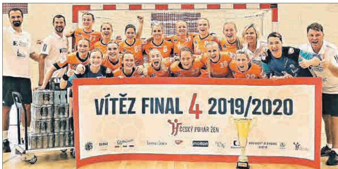
Hráčky a realizační tým Dámského házenkářského klubu Baník Most se radují z velkého úspěchu.