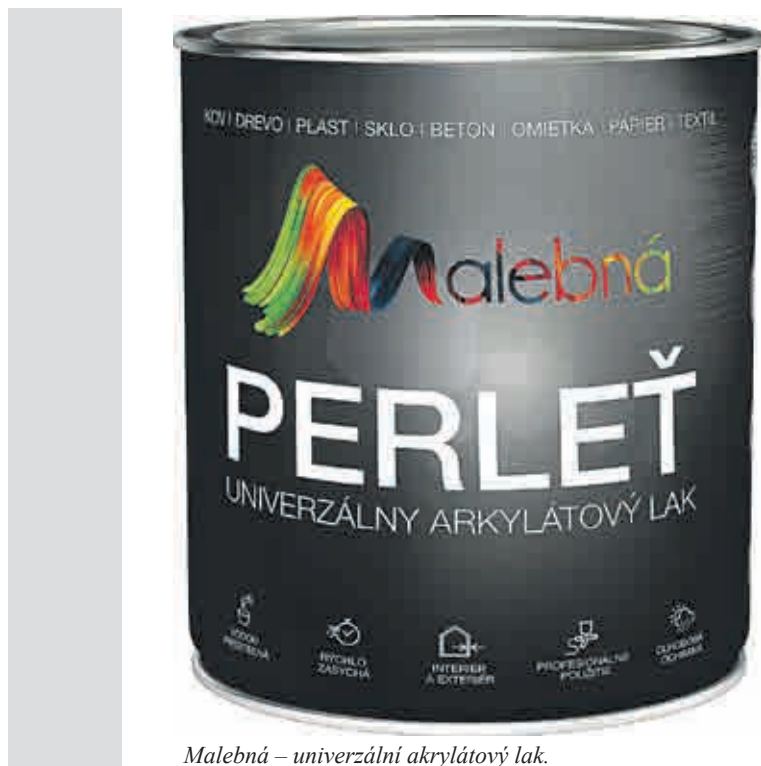
Malebná – univerzální akrylátový lak.