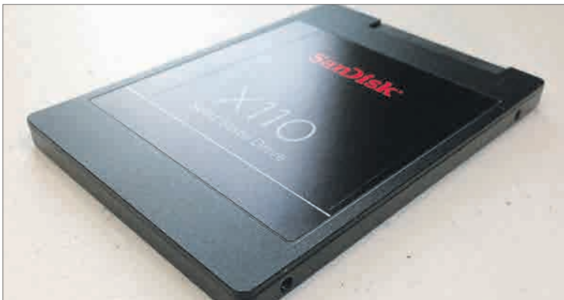
SSD disk má oproti HDD disku určité výhody. O nich se více dozvíte v článku vlevo.

V současné době se HDD používá jako druhý disk či záložní úložiště. Své uplatnění najde také u kamerových systémů. HDD disk je tedy ideální kandidát pro ukládání velkého množství dat, nebo pro ukládání po delší dobu (fotografie, filmy atd.). Další výhodou je cena, která je, v případě