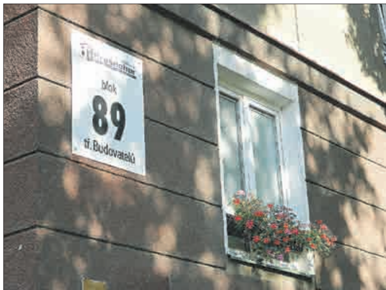
Někteří vlastníci bytů si potrpí na hezkou výzdobu svých oken.