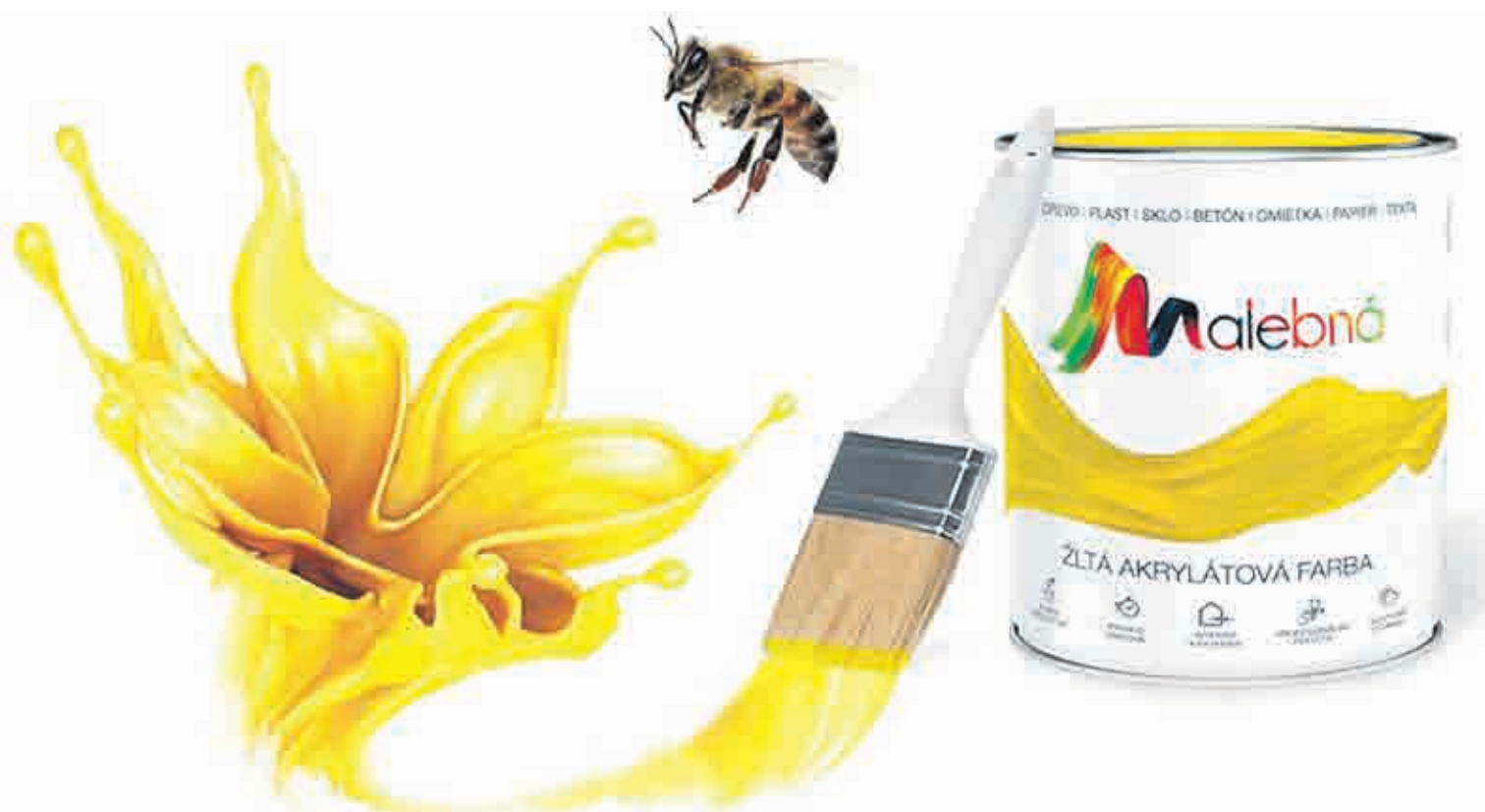
Malebná je natolik kvalitní barva, že může splést i včelu.