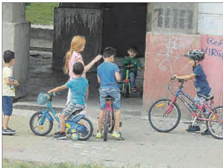
Děti běhají kolem domu a křikem se domlouvají.