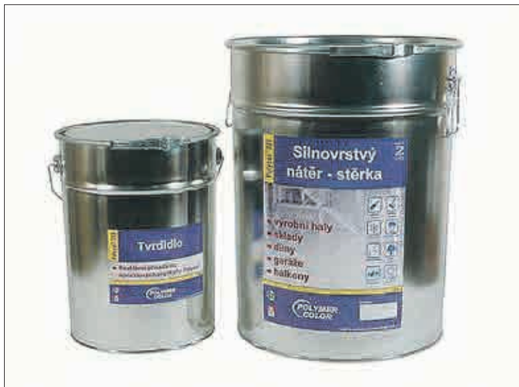
Stěrka a tvrdidlo Polycol 321 L.

Povrch nesmí být kletován ani poprašován cementem. Před vlastní pokládkou musí být povrch důkladně zameten nebo vysáán průmyslovým vysavačem. V případě nenosného povrchu, způsobeného například vystouplým cementovým mlékem, výluhem aditiv z vyrovnávacích stěrek, korozí, drobením, odlupováním, nebo pokud je povrch znečištěn ropnými produkty (jako jsou nafta, oleje, asfalt), či jiným separátorem je nutné pro-