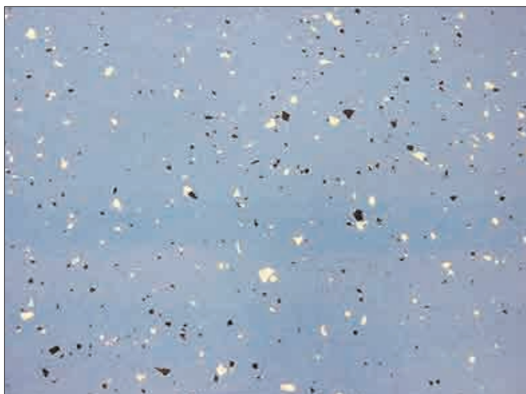
Lité stěrka s dekorativními chipsy (lze opatřit světélkujícími nebo stříbrnými flitry).