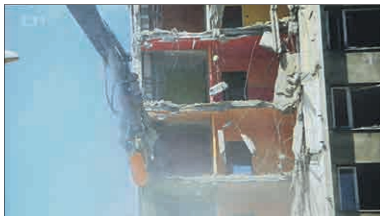
„Tímto způsobem se mají postupně zbourat další tři prázdné paneláky. Mohly by jít k zemi na podzim,“ zaznělo v reportáži. Pošle do té doby stát peníze?