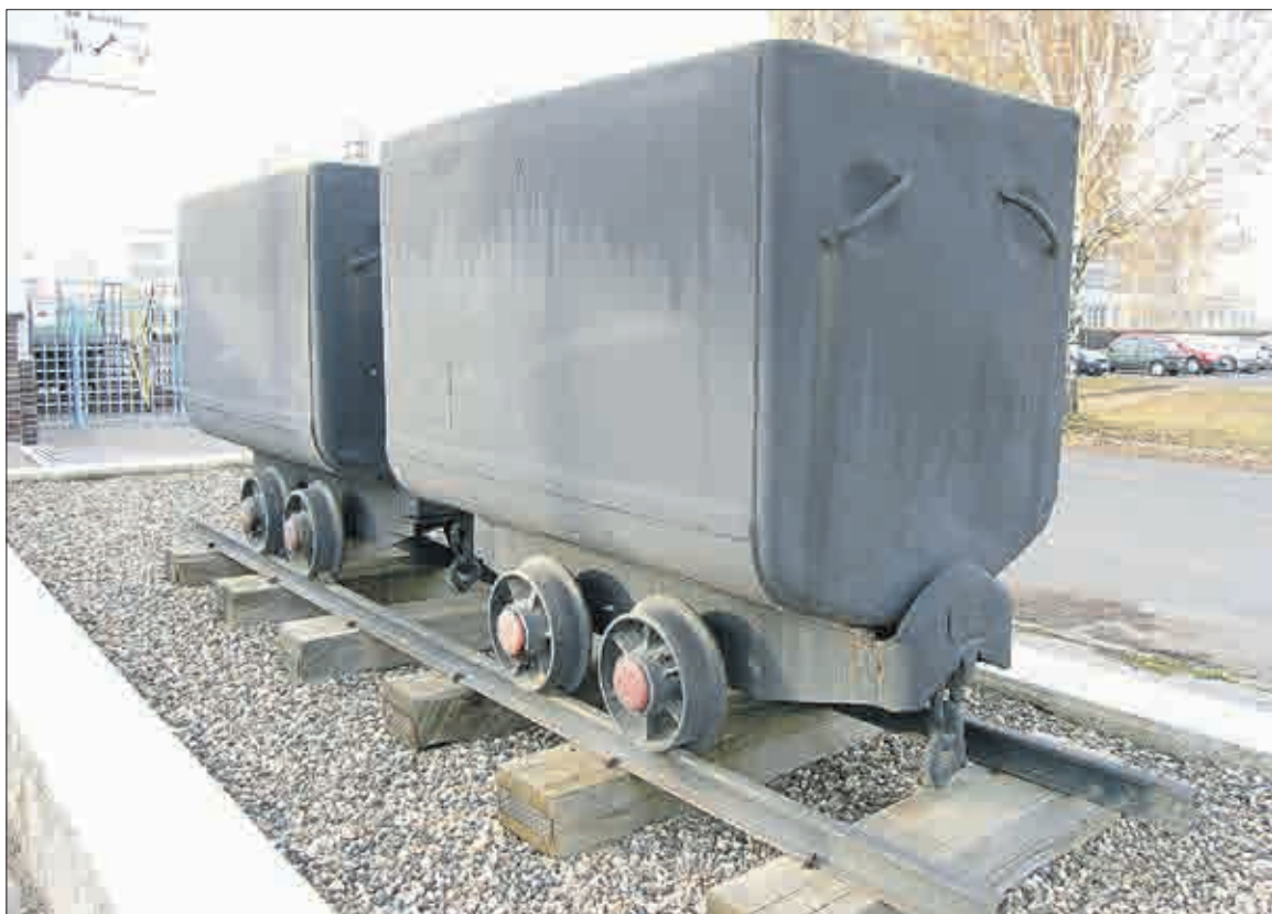
Vzpomínka na nejslavnější hornické časy (před areálem Palivového kombinátu Ústí).

Co vůbec plánujete vybudovat v okolí jezera? Chcete přece přilákat lidi, aby jezero začalo plnit rekreační funkci. Dost se taky hovoří o MiniMostě – o projektu, jenž by měl drobnými stavbami připomínat těžbou zlikvidované královské město,