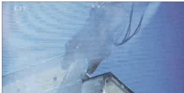
Půl druhé odpoledne. Obří nůžky se zakusují do zdevastovaného paneláku. Začíná demolice domu. Postupuje velice rychle. Kolem dokola je hodně prachu.