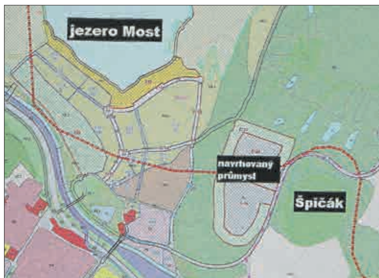
Veřejnost zneklidněl tento výřez z mapové dokumentace Magistrátu města Mostu k územnímu plánu. Výřez byl před časem publikován v Mosteckém deníku. Podle něj by v blízkosti místa pro odpočinek milovníků vody a plážových sportů měl vzniknout průmyslový areál. Žert, nebo tlak průmyslové lobby?