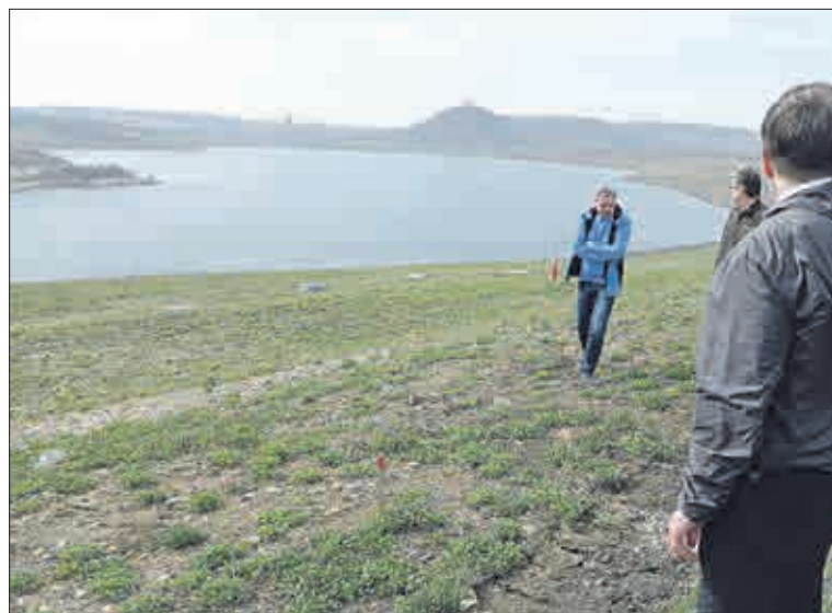
Vodní plochu jezera Most pohledem z litvínovské části okresu obdivovala delegace Rady bytových družstev severočeské oblasti (Ústecký a Liberecký kraj) v dubnu 2018. Zavedla ji sem vyjíždka společnosti Offroad Safari. Kousek odtud je vojenský bunkr, který se může stát lákadlem výletníků k jezeru.