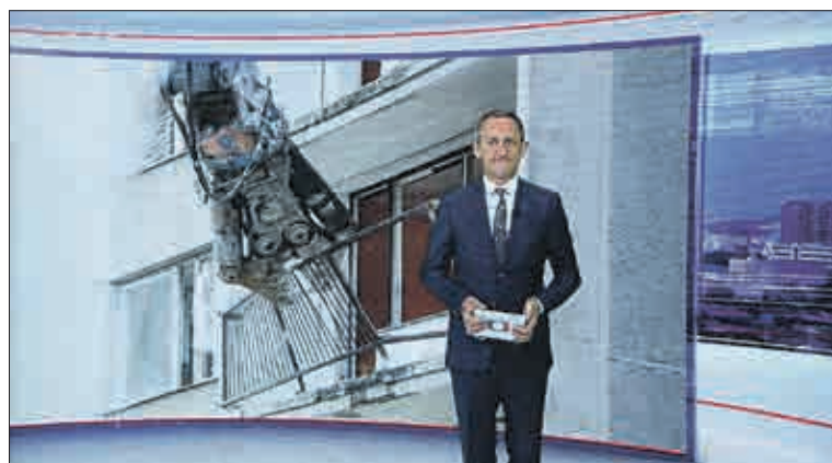
„Demolice vybydleného paneláku. Dnes začala v největší vyloučené lokalitě v zemi – v litvínovské čtvrti Janov. Podle radnice je to jeden z prvních kroků jak oživit celé sídliště,“ uvedl v Událostech, hlavním zpravodajském pořadu České televize, moderátor Michal Kubal.