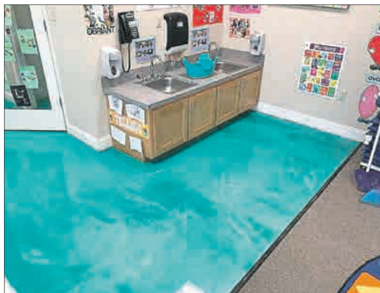
Podlaha s metalickým efektem.

■ Parametry a úprava podkladu: Aby vytvrzená hmota vykazovala optimální užité mechanické vlastnosti, musí být aplikována na betonové podklady předepsaných parametrů za normálních podmínek. Teplota podkladu 15 – 20 °C, relativní vlhkost vzduchu 50 %, vlhkost podkladu maximálně 4 %. Aplikaci provádějte při teplotě nejméně 3 °C nad rosným bodem. Betonový podklad musí být vyzrálý nejméně 28 dní, suchý, izolovaný proti vlivům spodní vlhkosti nebo podsklepený. Povrch nesmí být kletován ani poprašen cementem. Před vlastní pokládkou povrch důkladně zameťte nebo lépe vysajte průmyslovým vysavačem. Pozor! Prachové částice