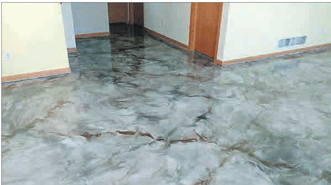
Podlaha s mramorovým efektem.

■ Vyrábí se v odstínech: dle vzorkovnice RAL. Také lze použít vsyp s chipsy.