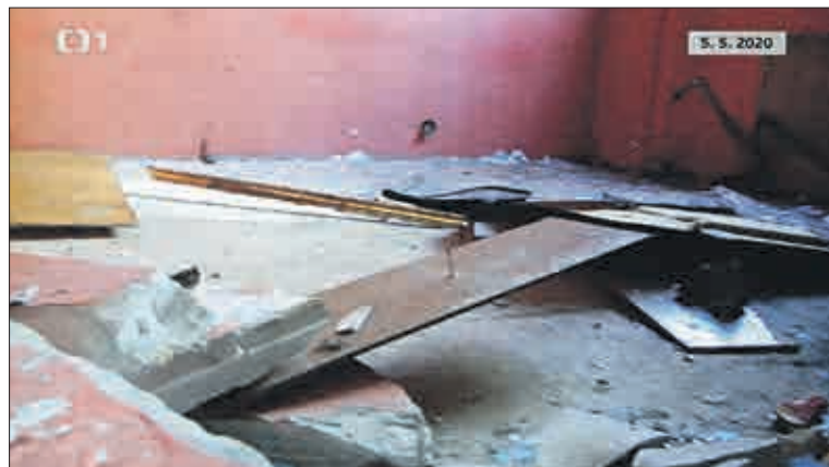
Většina dělníků viděla takový nepořádek poprvé. Nedokázali pochopit, proč se takto ničí majetek. Jaký byl k tomu důvod?