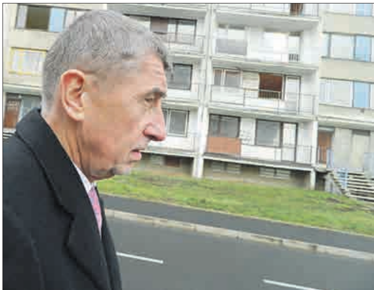
Leden 2020: Andrej Babiš právě prochází Gluckovou ulicí kolem zdevastovaného (nyní již zbouraného) domu. Starostka Kamila Bláhová premiéru záhy informovala o využití státní dotace na demolice vybydlených domů.

zastupitel města Litvínova lídr Sdružení Litvínováci (SL)