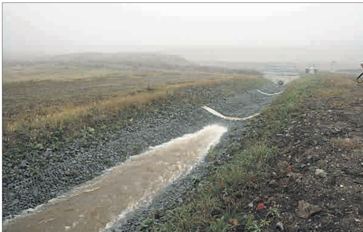
První tisíce litrů vody z Ohře se řítí do prostoru, v němž vznikne nové jezero.