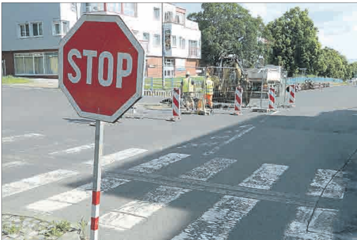
Už několik dnů probíhala „velká“ akce, když se náhle vyskytla „malá“ – havárie kanalizace před restaurací Veronika v sousedství Krušnohory. Lidé ze SčVK a SVS okamžitě začali konat. Havárie dokládá potřebnost velké investice.

Podle sdělení mluvčího se zde nacházejí úseky vodovodní-