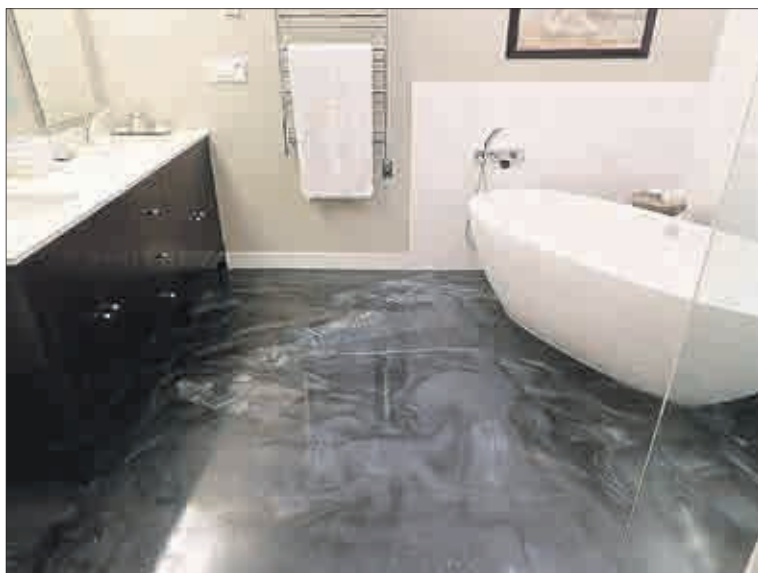
Podlaha s metalickým efektem.