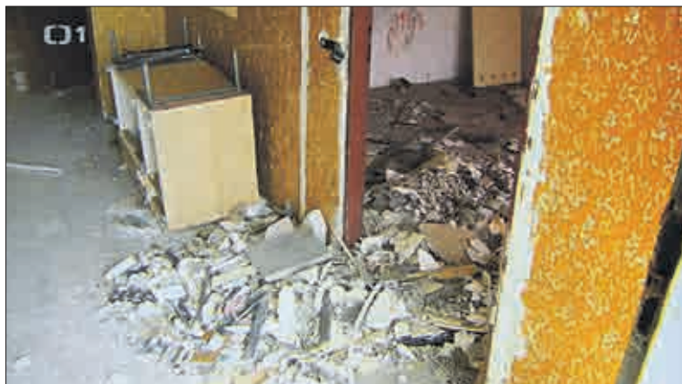
Takto vypadala řada bytů. Dělníci si často kladli otázku, jak v nich mohli lidé vůbec bydlet. Jejich odpovědí bylo nechápavé kroucení hlavou.