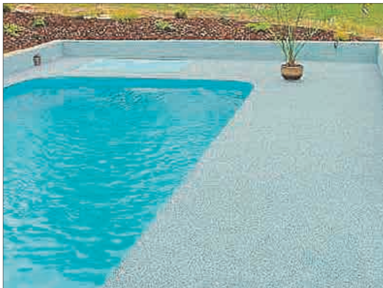
Podlaha u bazénu (polymerbeton).

a roztáhněte ocelovým pravítkem, zubovou stěrkou nebo rozhrnovacím válcem. Následně důkladně odvzdušněte roztaženou stěrku odvzdušňovacím válcem (tzv. ježkem). Odstranění bublinek vzduchu z povrchu stěrky je možné též provést za pomoci takzvaného xylen spreje, případně horkým vzduchem.