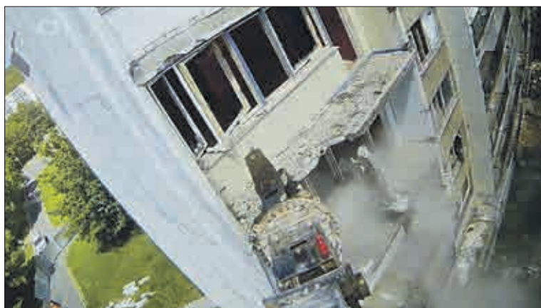
Dům zmizel za necelé dva týdny. „Bude zde oddychová volnočasová plocha, klasický park,“ sdělila mluvčí města. Určitě udělá radost rodičům a dětem.