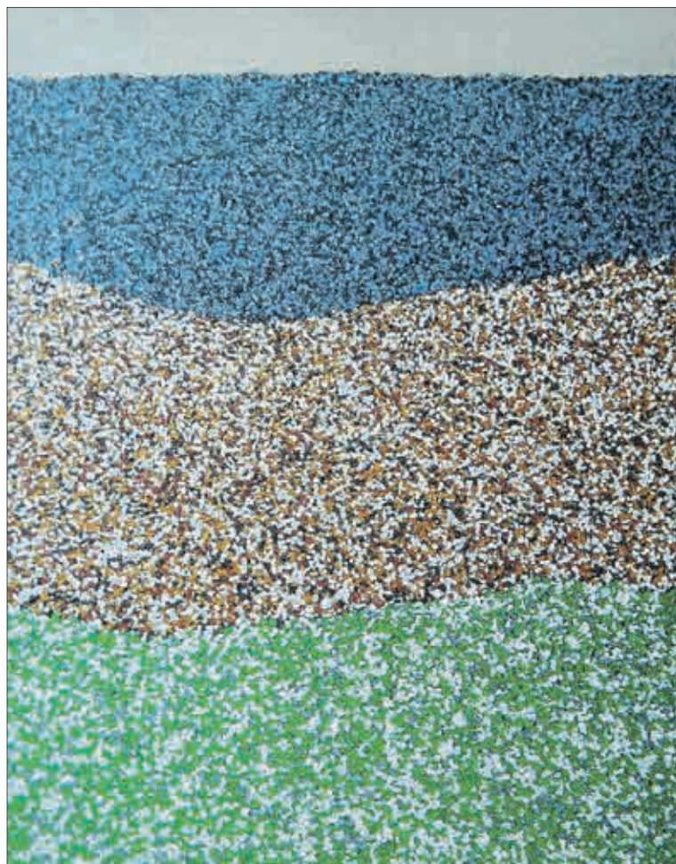
Litá stěrka (polymerbeton) se vsypáním barevných písků (různých zrnitostních frakcí).

■ Technologický postup zpracování: Zpenetrujeme podklad epoxidovou penetrací Polycol 225. Po 24 hodinách aplikujeme samotný komplet. Polycol 117 se smíchá s tvrdidlem Polycol 593 a důkladně promíchá po dobu 2 minut pomocí vhodného mechanického míchadla. Směs se vlije do písku a míchá tak dlouho, až je veškerý písek zcela smočen. Připravujte si vždy jen takové množství materiálu, které jste schopni zpracovat do 30 minut. Polymerbetonovou kompozici nanese-