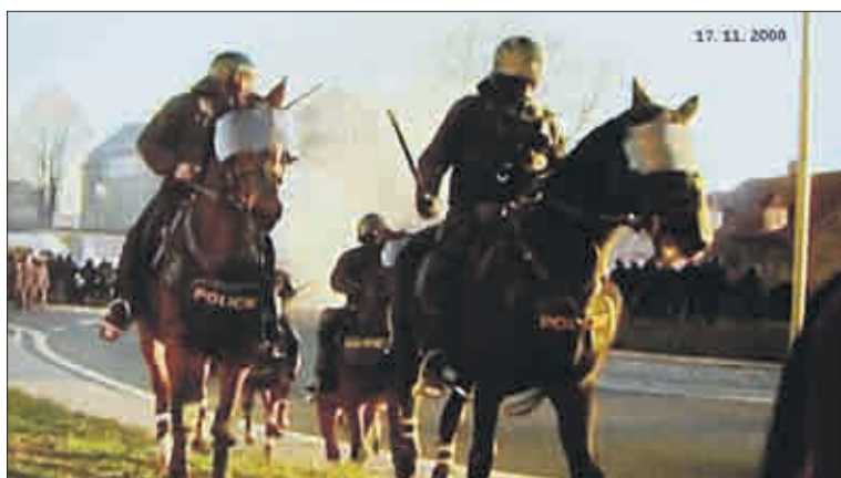
„Situaci v Janově město řeší intenzivně od roku 2008,“ pravil komentář k záběrům. Tehdy zde došlo k demonstraci slušných bydlících proti nepřizpůsobivým. Mnoho litvínovských občanů má ale dodnes o „intenzitě řešení“ pochybnosti. Mají představu o vyšší rychlosti a větším důrazu ze strany politiků a úředníků.